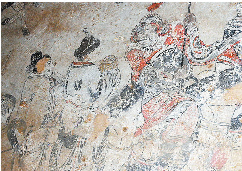
泰山庙正殿内的明代壁画，展现了东岳大帝出宫巡游的壮观场面。