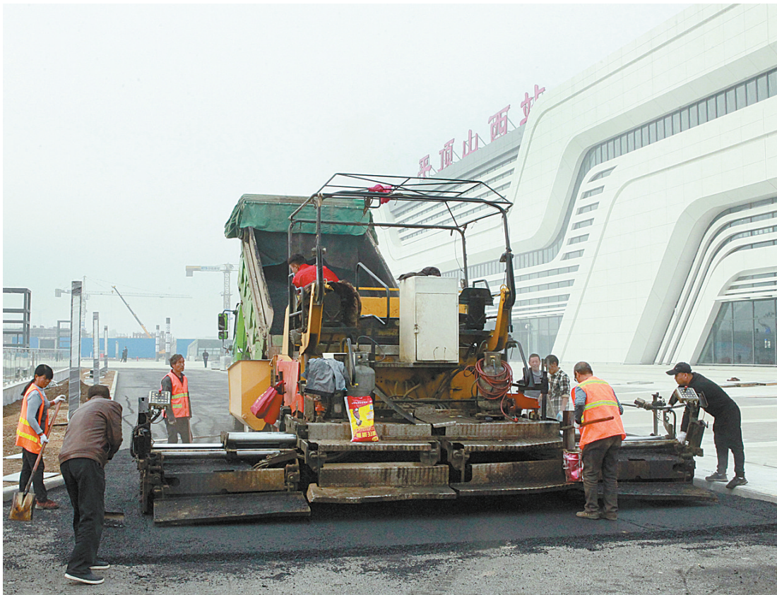
施工人员正在铺设候车大厅前的路面