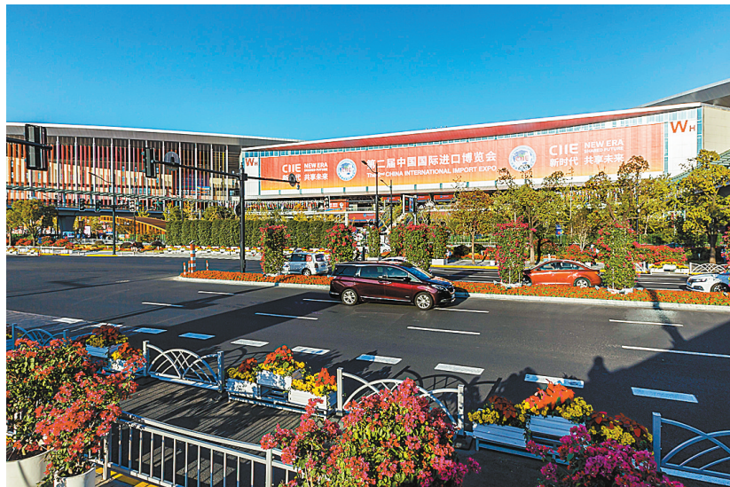
昨天拍摄的国家会展中心(上海)西入口外街边的花卉装饰。

据《北京青年报》报道，第二届中国国际进口博览会将于11月5日至10日在国家会展中心(上海)举行。11月2日，第二届中国国际进口博览会新闻通气会在上海国家会展中心召开，通气会介绍了第二届进博会的筹备情况以及上海市在城市保障等方面开展的工作。记者了解到，第二届进博会主宾国增加到15个，新亮相的国家超过三分之一。国家馆将在进口博览会结束之后实施延展，为期8天。