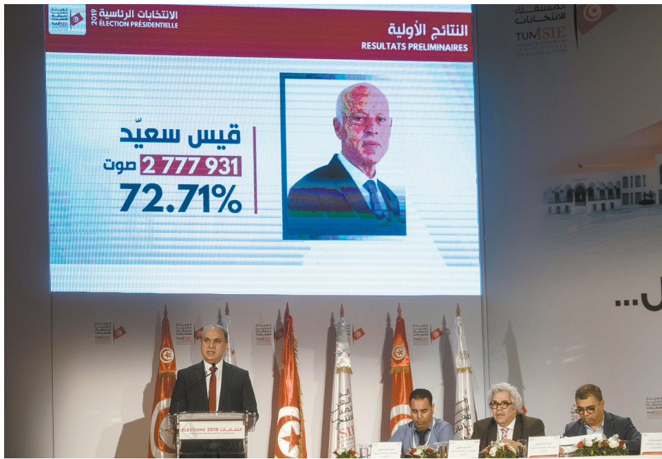
10月14日,在突尼斯首都突尼斯市,突尼斯最高独立选举委员会主席巴冯(左一)在新闻发布会上讲话。

姓对现政府的执政能力和政策非常失望,渴望改变现状,他们以投票表达了出现新面孔以改变国家当前政局的意愿。