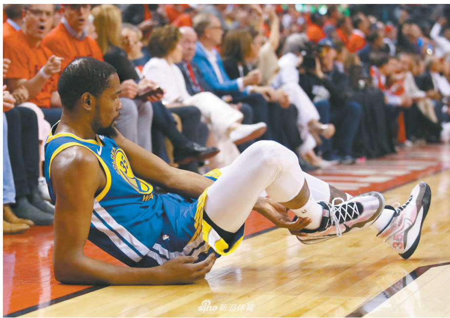
杜兰特的伤情有待核磁共振确诊,勇士总经理迈尔斯泪洒发布会。