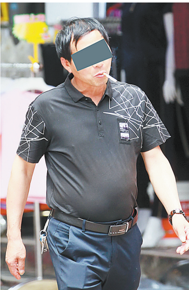
昨天上午，记者在市区一些人流比较集中的公园、商场看到，嘴叼香烟的烟民不时可见。