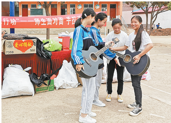
市四十一中学生代表把捐赠的乐器送到鲁山县土门中学的学生手中。

据悉，市四十一中已先后为土门中学捐赠图书、电脑等教学设施和办公用品，建立理化生实验室、音乐教室，累计投入487万元，有效改善了帮扶学校教学条件。