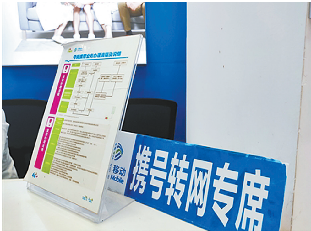
江西吉安中国移动某营业厅设置的携号转网咨询专席。(新京)

新流程分三步：第一步：通过手机短信在线查询携转资格(短信编辑CXXZ#用户名#证件号码，发送至归属运营商，移动10086，联通10010，电信10001)。第二步：查询符合条件后，通过手机短信申请授权码(短信编辑SQXZ#用户名#证件号码，发送至归属运营商，移动10086，联通10010，电信10001)。授权码有效时间30分钟。第三步：收到授权码以后，凭有效证件和授权码到拟转入的运营