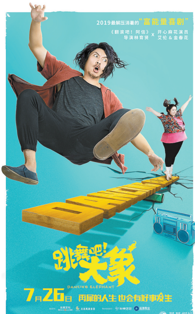
《跳舞吧！大象》定档海报

本报讯 由林育贤执导，艾伦、金春花领衔主演，彭杨、宋楠惜、静芳共同主演的励志富能量喜剧电影《跳舞吧！大象》昨天发布定档海报及预告片，正式宣布定档7月26日。该片是台湾金牌导演林育贤继《翻滚