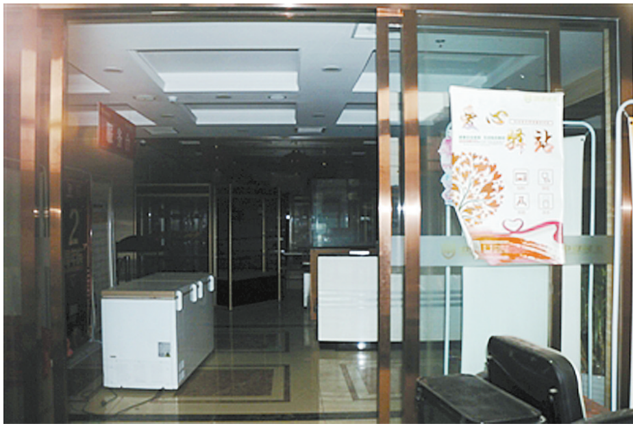
4月9日，位于海淀区紫金庄园的中安民生养老服务服务有限公司大门紧锁，无人办公。(陈婉婷)

中国老龄事业发展基金会项目管理部门负责人告诉记者，老年健康基金管理委员会是中国老龄事业发展基金会的下属项目分会，其与中安民生是否存在合作关系仍在核实中。