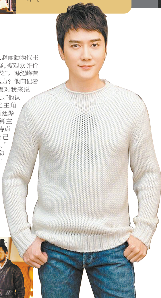
40岁的冯绍峰迈入人生新阶段