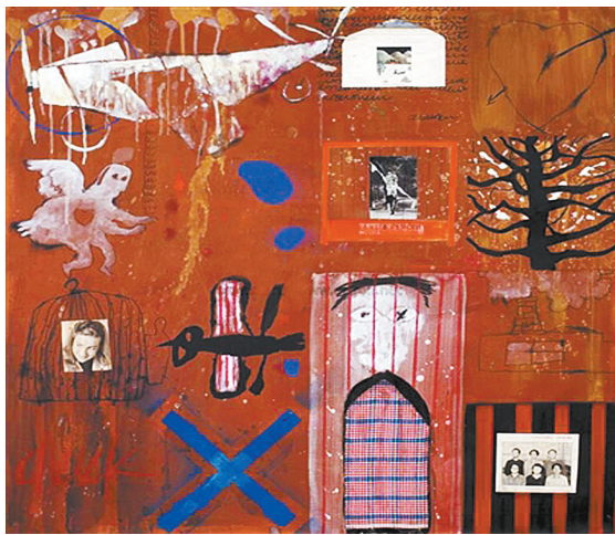
叶永青 1994 年作

自贡市公安局贡井区分局溪渡街派出所民警证实,当事院方已报警,目前正在搜寻中。(倪兆中)