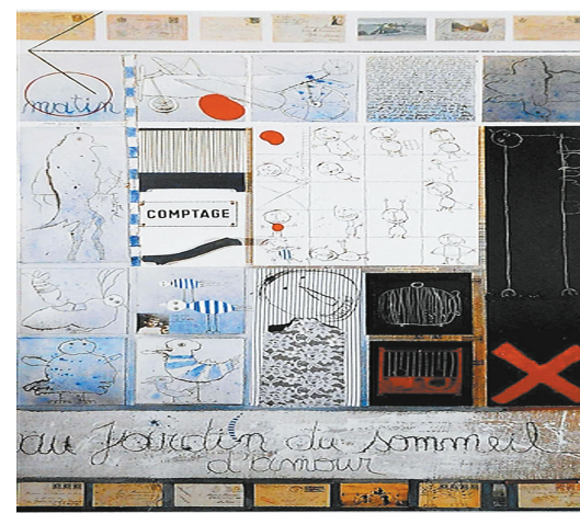
希尔文 1986 年作品