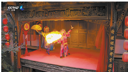
川剧的拍摄一镜到底

2017年春节期间,大型系列纪录片《航拍中国》第一季一播出便走红网络。历时两年,由中央广播电视总台央视纪录频道出品、央视纪录国际传媒有限公司承制的《航拍中国》第二季即将于3月3日起在央视多频道、多平台推出。据悉,第二季选取了内蒙古、江苏、浙江、福建、广东、四川、甘肃七个省区,通过航拍视角讲述七省区的自然地理、人文历史和社会经济发展三方面内容,展现中国的“大、美、奇、变”。