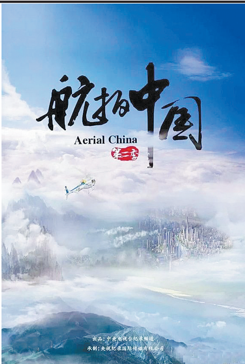
出品:中央电视台纪录频道 承制:央视纪录国际传媒有限公司