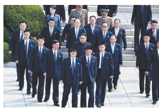
朝鲜安保人员以“V”字形护卫金正恩。(资料图)