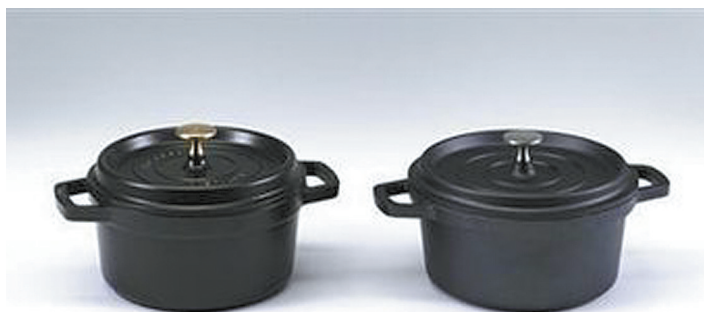
↑获奖名单中被提及的仿冒锅具产品 →“金鼻子剽窃奖”奖杯 官网截图