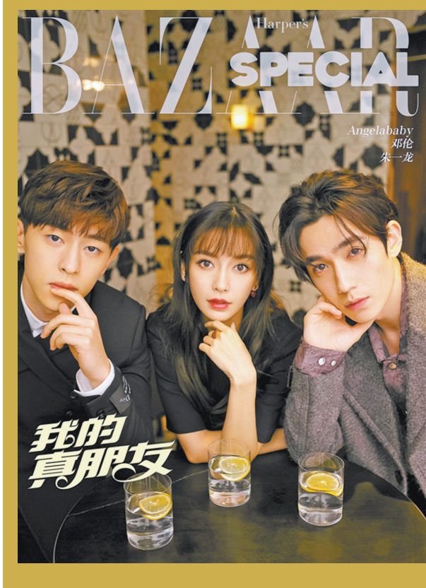
Angelababy 邓伦 朱一龙