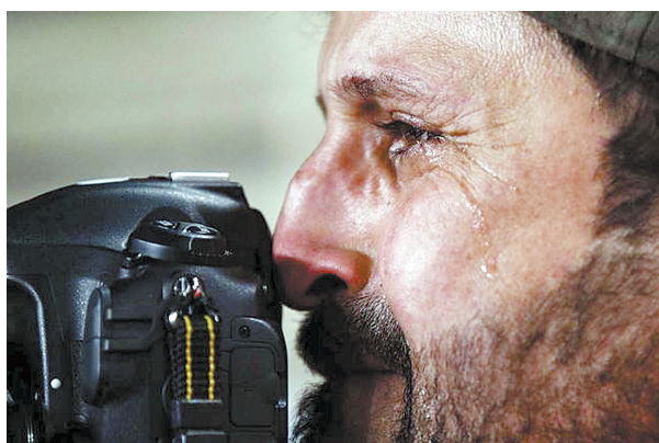
伊拉克0:1不敌卡塔尔出局。比赛最后时刻,在场边工作的伊拉克摄影师不甘球队失利,含泪继续拍摄,这一幕感动了很多中国人。(刘思远)

最后一场16强战中,伊拉克队占据场上主动,但进攻更有威胁的却是卡塔尔队。开场仅4分钟,卡塔尔队就险些破门,哈桑禁区内一脚挑射击中横梁。上半场临近结束前,哈桑左路突破底线传中,球击中立柱弹出底线。拉维在第62分钟一脚任意球破门,攻入全场唯一进球。