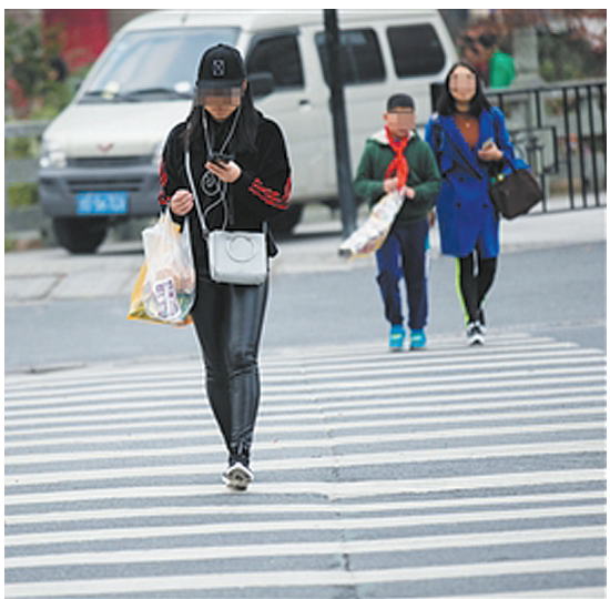
2017年11月28日，杭州市一条马路上，市民看手机过斑马线。

有专家指出，处罚行为能起到警示、警醒作用，但要想从根本上减少此类行为，应该通过法规来约束。也有专家认为，凡事都靠政策法规约束，立法、执法成本谁来承担？此外，处罚力度、行为的界定，有待进一步明晰。