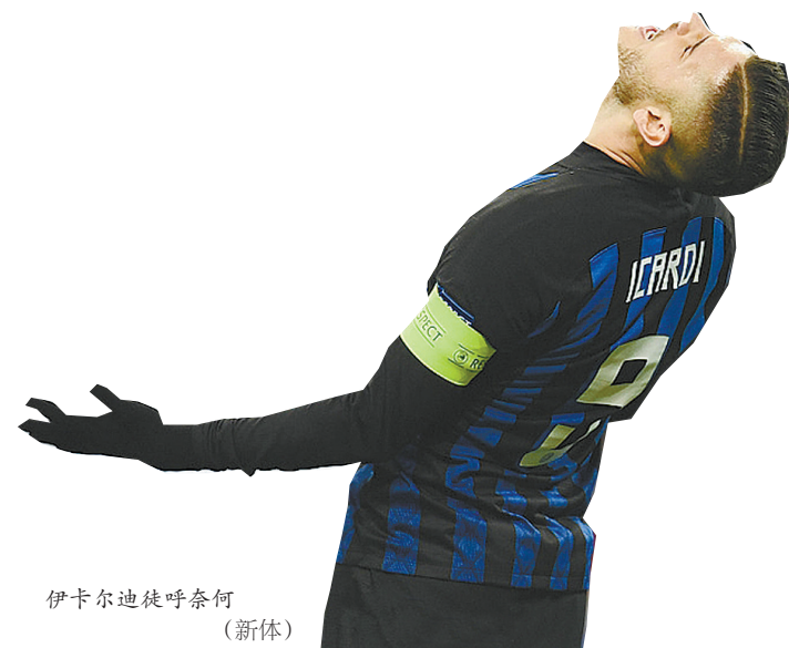
伊卡尔迪徒呼奈何 (新体)