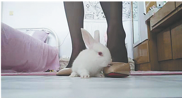
视频中,一只小兔正趴在女子脚边,而几分钟后,它却被身边这双脚踩死。