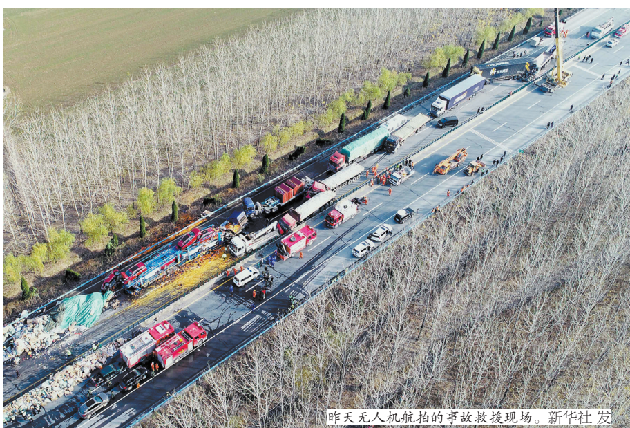
昨天无人机航拍的事故救援现场。

截至19日13时,事故中共有13名伤者送往医院救治,其中3人死亡,现场救援工作正在进行。