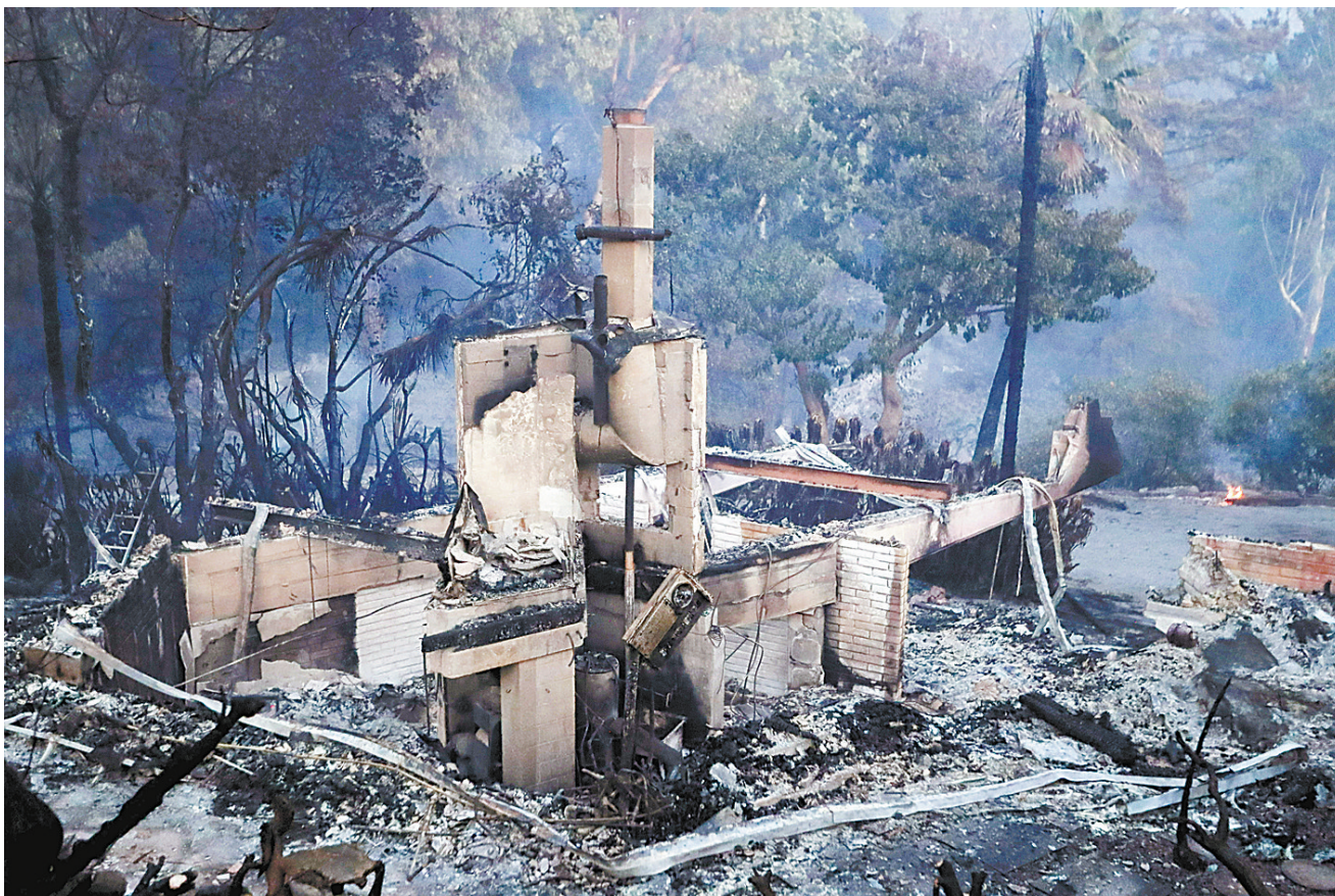
这是11月10日在美国加利福尼亚州马里布市拍摄的一处被烧毁的废墟。连日来，美国加利福尼亚州山火肆虐。

美国加利福尼亚州官员当地时间11月11日确认，全州内的多起山火已致总计31人遇难，其中北部的“坎普”山火导致29人死亡。