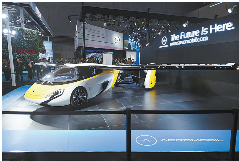
11月7日,人们参观一家斯洛伐克展商展出的“会飞的汽车”。