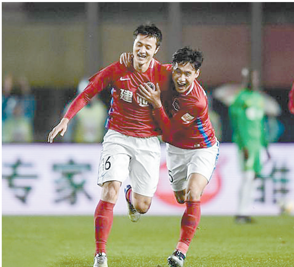
建业球员庆祝进球

本报讯 北京时间11月7日19点35分,2018中超联赛第29轮同时开赛。河南建业主场4:0痛击已提前降级的贵州恒丰,携四连胜之势成功保级。上海上港主场2:1胜北京人和,提前一轮夺冠。这是上港的中超首冠。