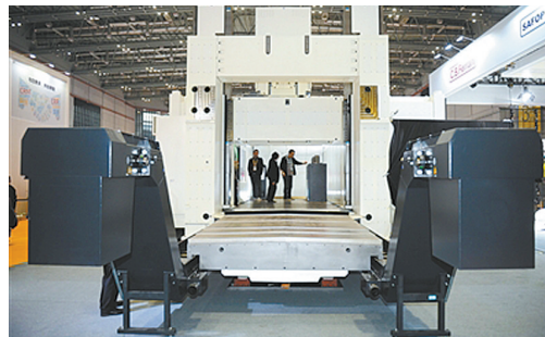
庞大的机床“金牛座”龙门铣