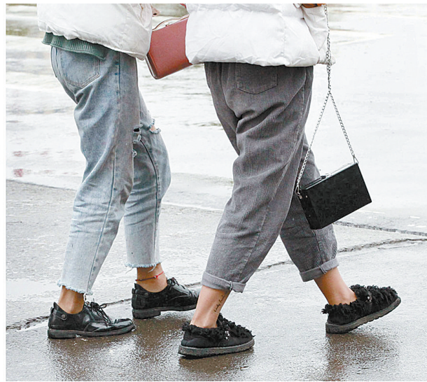
昨天，虽然冷风刺骨，但在市区街头裸腿装束的男女依然随处可见。

了。“我上个月就穿上秋裤了，骑摩托天天吹风，膝盖要是受凉了，受罪的还是自己。”小张说。大街上，一些骑三轮车的快递员也是全副武装，头盔、口罩、围挡样样不少，根本找不到一个露脚踝的。