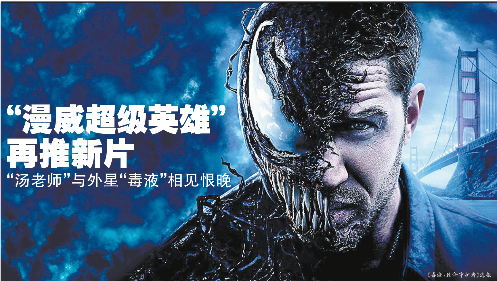
《毒液：致命守护者》海报

本报讯 由汤姆·哈迪、迈克尔·威廉姆斯、里兹·阿迈德等联袂出演的漫威超级英雄新片《毒液：致命守护者》11月4日在北京举行首映及IMAX版媒体观影，“汤老师”与“毒液”之间的“打情骂俏”、“暴乱”与“毒液”的终极对战都成为大银幕看点。