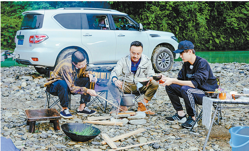
李诞、汪涵、林彦俊在野外生火做饭。