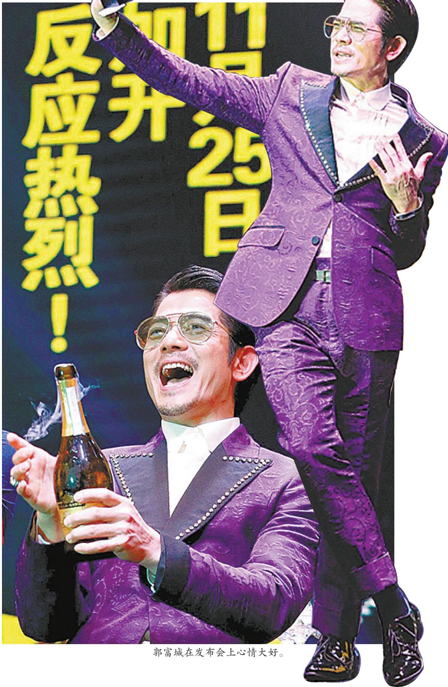
郭富城在发布会上心情大好。