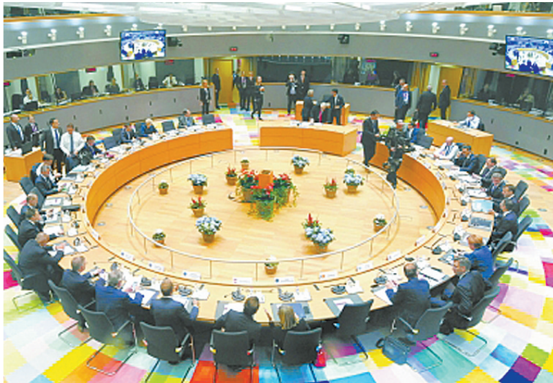
10月17日在比利时布鲁塞尔拍摄的欧盟峰会现场。

路透社报道，多数欧盟领导人确信，“脱欧”谈判的真正阻碍在于英国国内政治。法国总统马克龙的一名助理说，英国执政党保守党内部“硬脱欧”派人士宁愿不带任何附加条件地脱离欧盟，意味着即便梅与欧盟谈妥