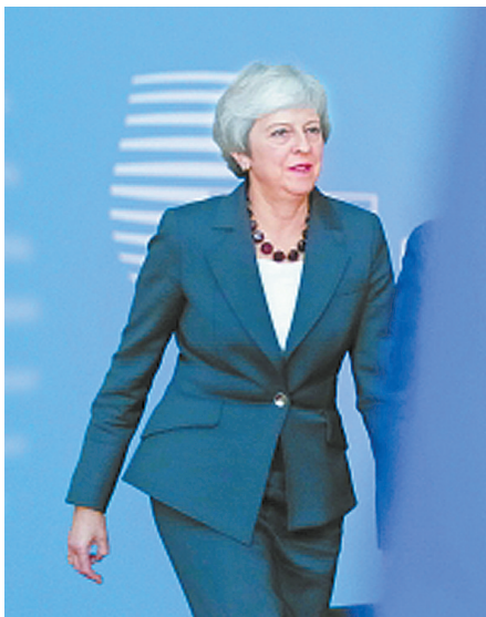
英国首相特雷莎·梅抵达峰会现场。

方先前同意，2019年3月至2020年12月为“脱欧过渡期”，其间英国依然遵循欧盟规则。设置“脱欧过渡期”旨在为确定英欧未来关系、解决英爱边界问题争取更多时间。