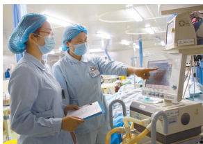
护理人员在查看监护仪器,掌握患者病情的变化。 本报记者 李英平 摄

去年12月22日,经市政府、市卫健委研究批准设立的平顶山重症医学专科联盟在总医院成立,总医院重症医学科再次强势发力,联合全市(县、区)级医院以及周边地区共计41家医院,在毫无保留的学科共谋发展的布局之下,总医院重症医学科以开放、包容、共赢的理念,建立了区域内危重症患者救护网络,通过资源共享,为中原地区重症医学专科的发展提供了强力支持。