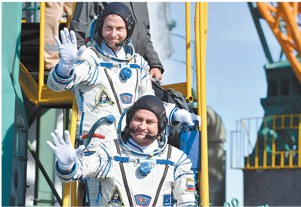
俄罗斯宇航员阿列克谢·奥夫奇宁(下)与美国宇航员尼克·黑格

获悉宇航员平安生还后,俄罗斯总统新闻秘书佩斯科夫说:“谢天谢地,宇航员还活着。”俄航天集团总裁罗戈津表示,飞船的紧急逃生系统表现出色,俄将成立国家调查委员会来调查此次事故。