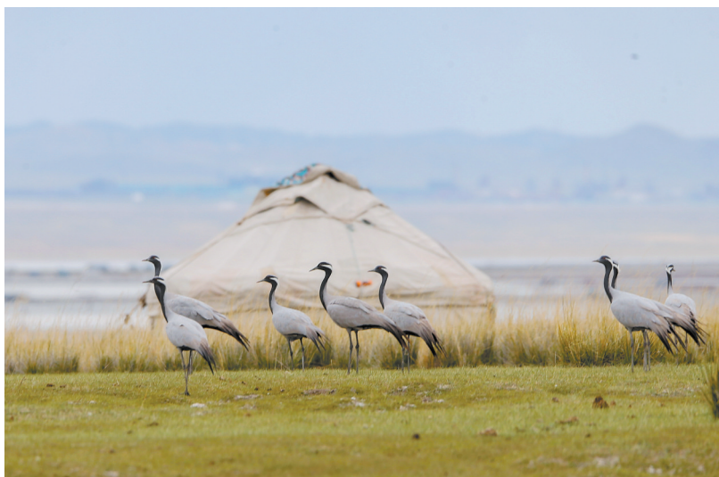
新疆巴里坤草原:蓑羽鹤