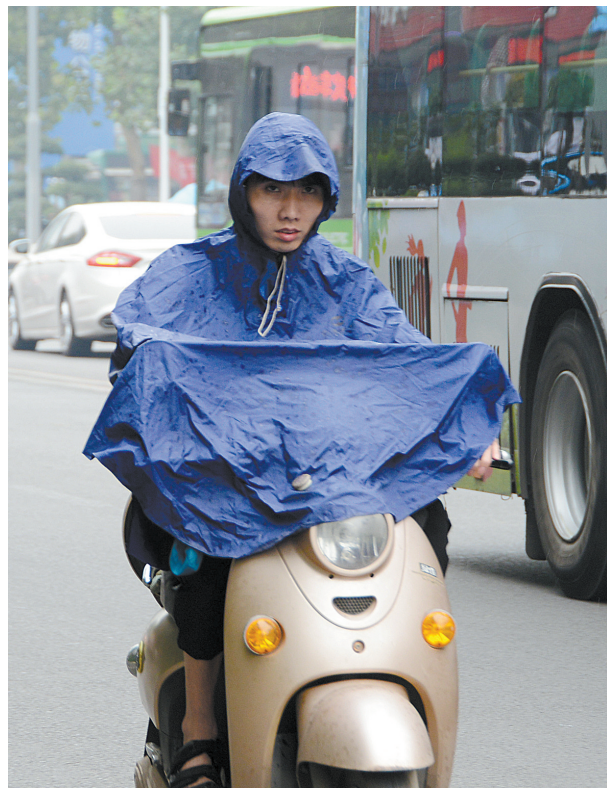
昨天上午,在市区中兴路街头,骑行的市民穿上雨衣出行。

今天白天到夜里,阴天有小到中雨,偏北风3级左右,23℃至20℃。15日,阴天有小到中雨,偏北风3级左右,20℃至24℃。16日,阴天有小雨,19℃至23℃。