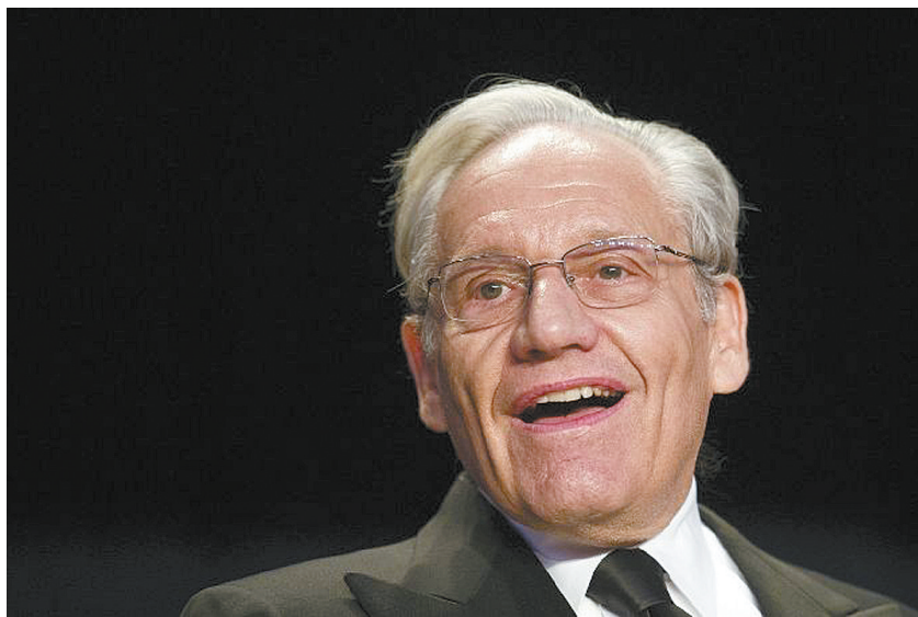
鲍勃·伍德沃德(资料图片)