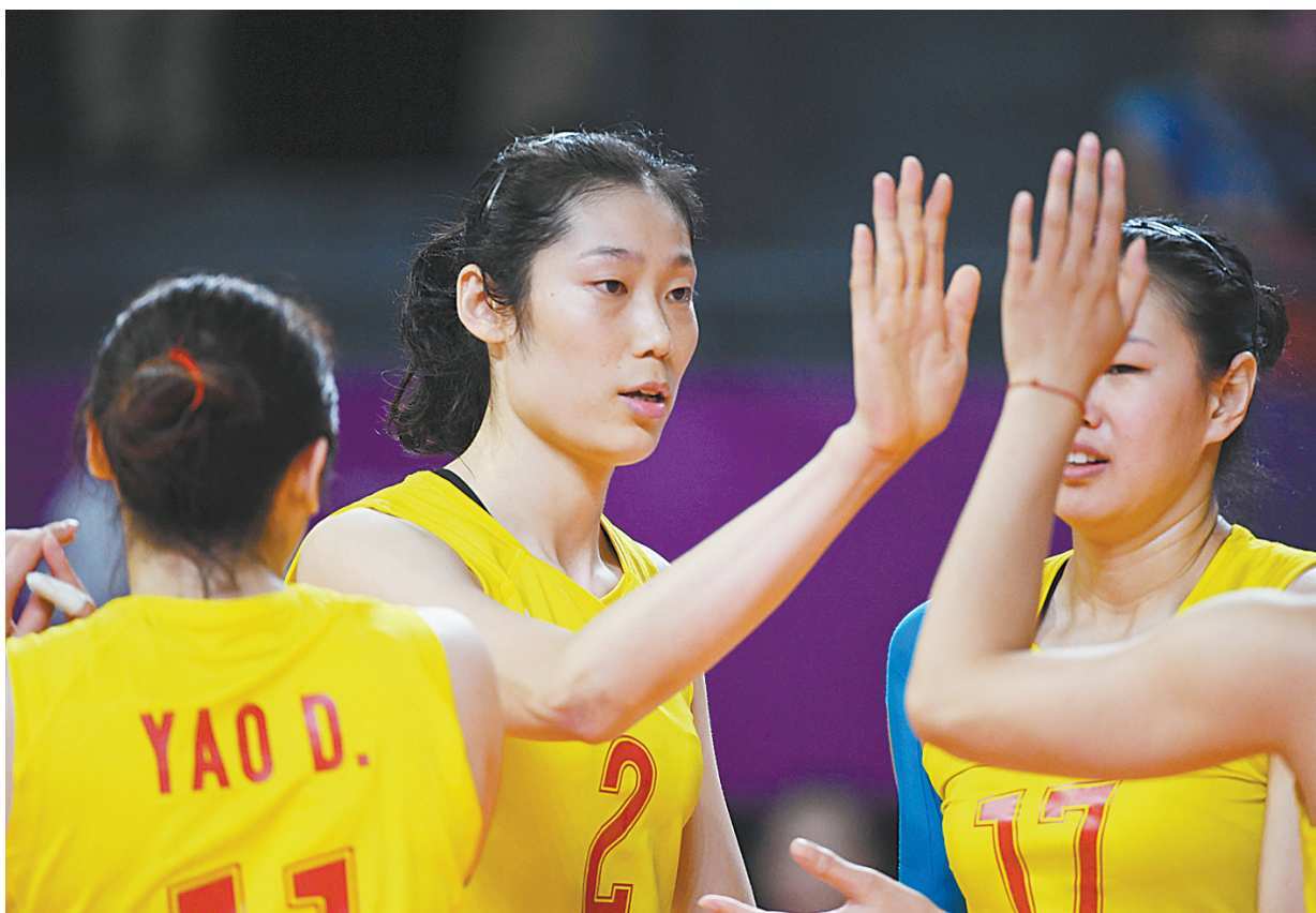
8月23日,中国队球员朱婷(中)在比赛中和队友庆祝得分。