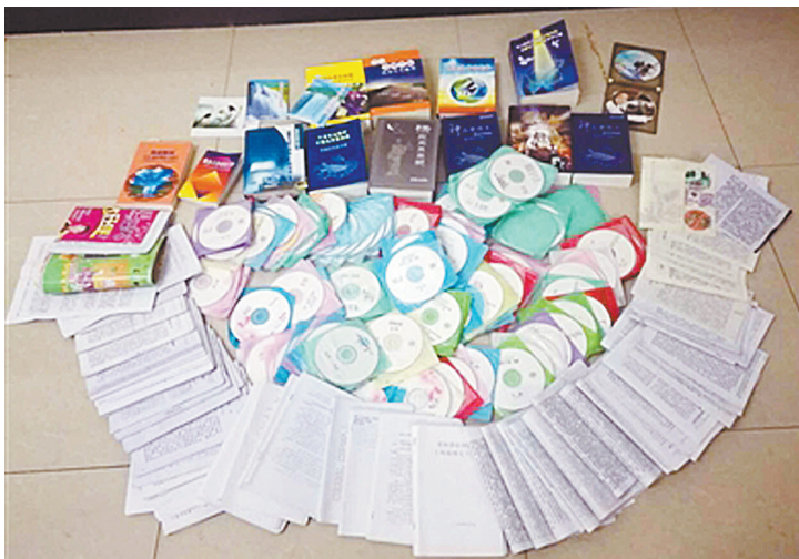
警方缴获的“全能神”宣传书籍和光盘

“全能神”邪教给信徒家庭带来了怎样难以治愈的创伤?邪教组织如何一步步给信徒洗脑?公安机关怎样帮助信徒逐步恢复正常生活?近日,记者深入采访公安机关办案民警和有关人员,了解案件有关情况。