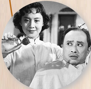
▲王丹凤年轻时照片 ▼《女理发师》剧照