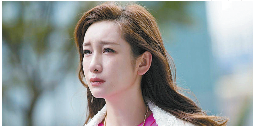
▲秦海璐《南方有乔木》剧照