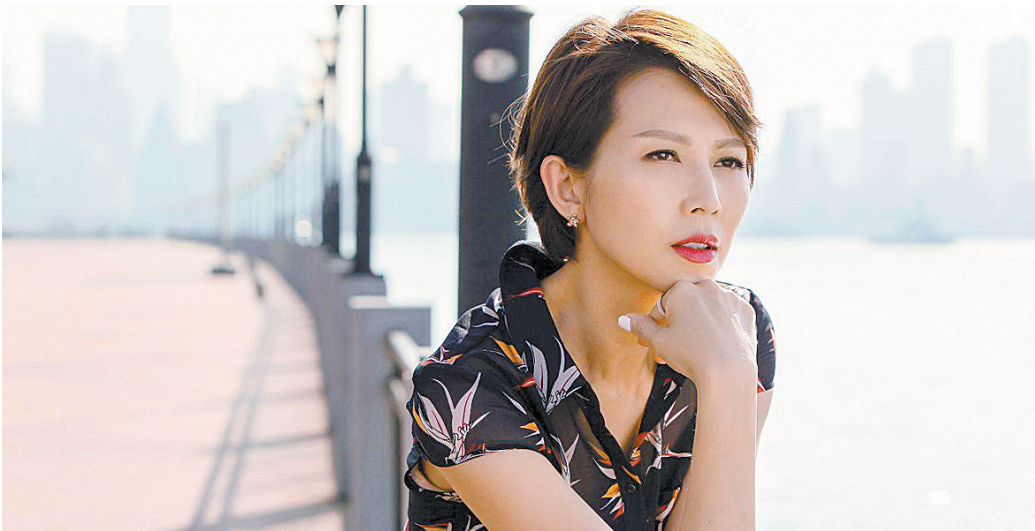
▲蔡少芬《海上嫁女记》剧照