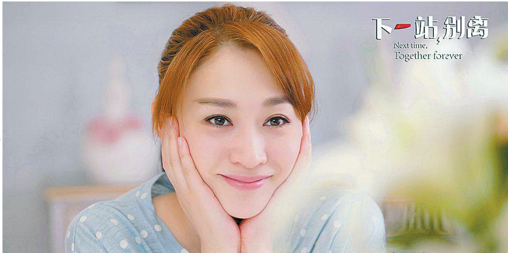
▲李小冉《下一站,别离》剧照