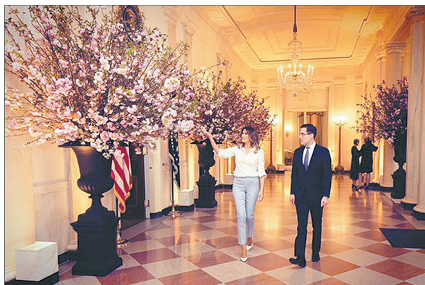
梅拉尼娅在推特上发布准备国宴的照片