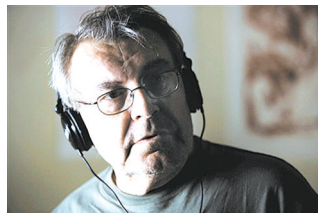
米洛斯·福尔曼(资料图)

本报讯 据媒体报道,两度获奥斯卡最佳导演奖的名导米洛斯·福尔曼(Milos Forman),美国时间4月13日在家里过世,享寿86岁。福尔曼凭《飞越疯人院》与《莫扎特传》打开知名度,作品从《爵士年代》到《月亮上的男人》,都在电影中替现实生活中的怪人与外人,用英雄式的自我表达挑战现有制度。