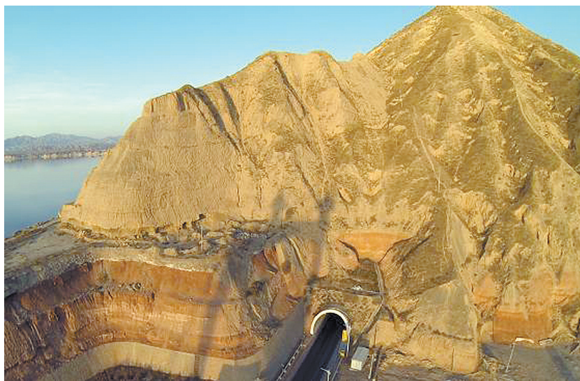
这条路上的“考勒隧道”被曝出严重的质量问题

二是成立以厅长为组长的调查工作组，赶赴现场组织交通质监、安监、公安交警等部门专家对考勒隧道安全再次进行检测评估，