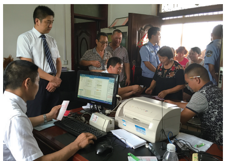
农信人上门服务发补贴

近年来,市农信社始终秉承“笃守诚信、争创一流”的经营理念,在推动各项业务健康发展的同时,不断建立健全服务体系,创新服务模式,提升服务质效,赢得广大市民的信赖。