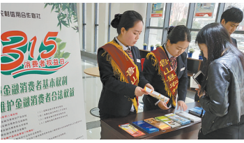
鲁山县农信社“3·15”金融消费者权益日宣传

区营业网点配备自动补登折、自动发卡机、零钱兑换机等智能化服务。在偏远乡村设立农民金融自助服务站,实现行政村便民金融服务网点全覆盖。截至今年2月,我市农民金融自助服务站达到972个、自助设备582台。积极开展反假币、反洗钱、金融知识进万家等公益宣传活动,制作大型户外广告牌27幅、宣传展板