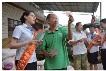
进村入户讲解金融知识

——提升服务效能。推进实施智能化升级,改善服务环境,配备便民设施,提升客户体验舒适度。增设便民设施,在城