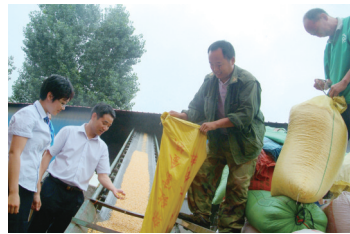
在粮食收购点调查粮食购销贷款使用情况