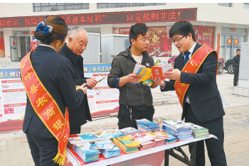
叶县农商行“3·15”宣传金融知识