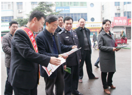
金融知识进万家宣传