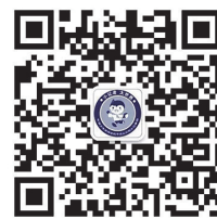
微信扫一扫 关注该公众号