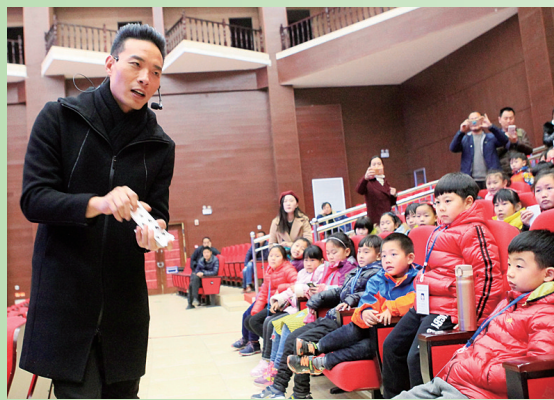
丁德龙教你玩魔术

活动当天第一站是来到宝丰演艺中心，与魔术大师丁德龙面对面，丁德龙将与晚报小记者开展一系列互动活动，相信这次活动一定会让小记者们大开眼界。