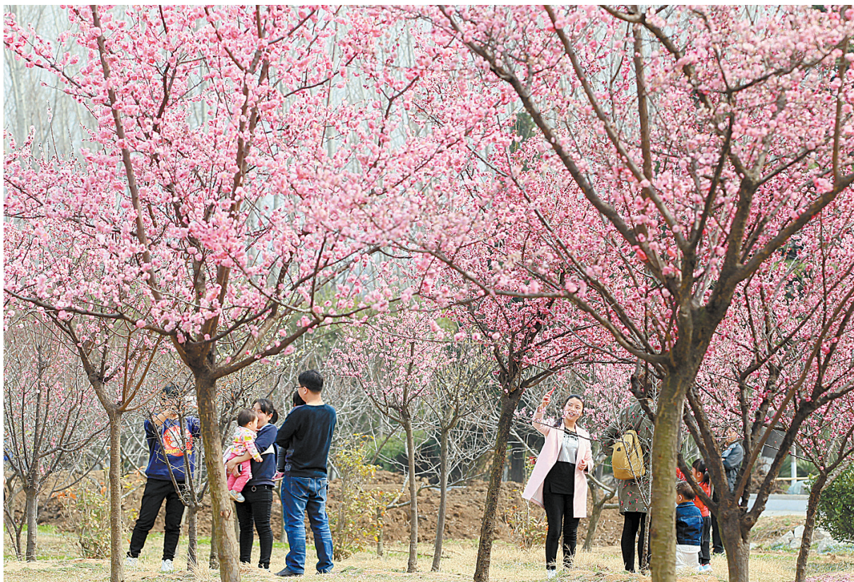
在白鹭洲国家城市湿地公园西南侧园区里,大片盛开的梅花引来众多市民观赏。