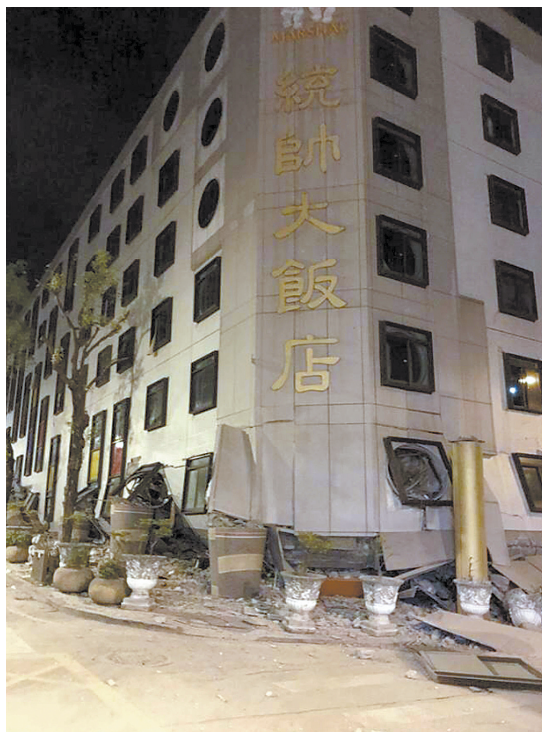
位于花莲的统帅大饭店发生倾斜

对此,徐德诗告诉记者,这两个地方的地震不存在重复性,也没有必然联系,更不可能成为规律。只能说在研究中发现两次地震时间相近,不能当成一种趋势来看。