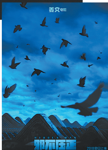
第三张以蓝色为主背景的海报