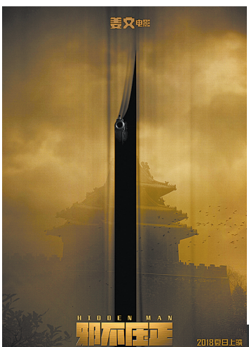
第一张土黄色作为主色系的海报

如《一步之遥》主打女性元素,女人大腿与枪的元素表明姜文的“恋足癖”,还有弹壳底火帽做的金币象征着影片欲望与争斗的主题。而《让子弹飞》的海报,主要以子弹为道具引发创意,一个是给子弹装上螺旋桨,一个是让子弹飘在羽毛上,都代表着让子弹飞起来。(滕朝)