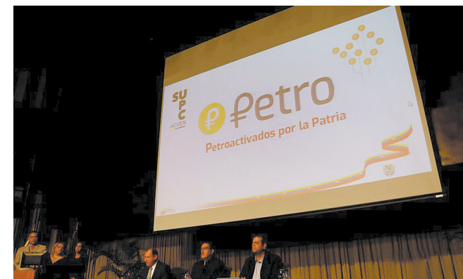
委内瑞拉总统马杜罗此前曾表示,每一枚官方加密数字货币“石油币”(Petro)的价值在委内瑞拉等同于一桶原油的价值。(中新)

委内瑞拉政府多次表示,石油币是世界上第一个由主权国家发行并具有自然资源作为支撑的数字加密货币,具有跨境支付和国际融资功能,将帮助委内瑞拉度过目前的经济困难,打破美国的金融封锁,推动国际金融秩序公平以及新兴经济