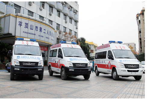
最近投入使用的3台新型高端救护车