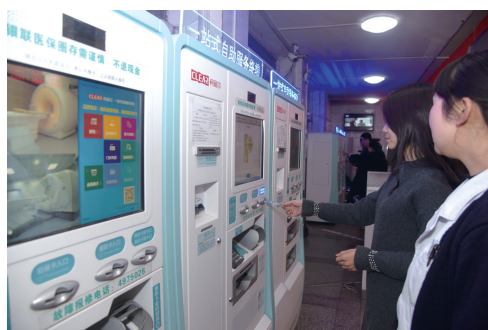
患者可以通过自助服务终端设备进行缴费挂号