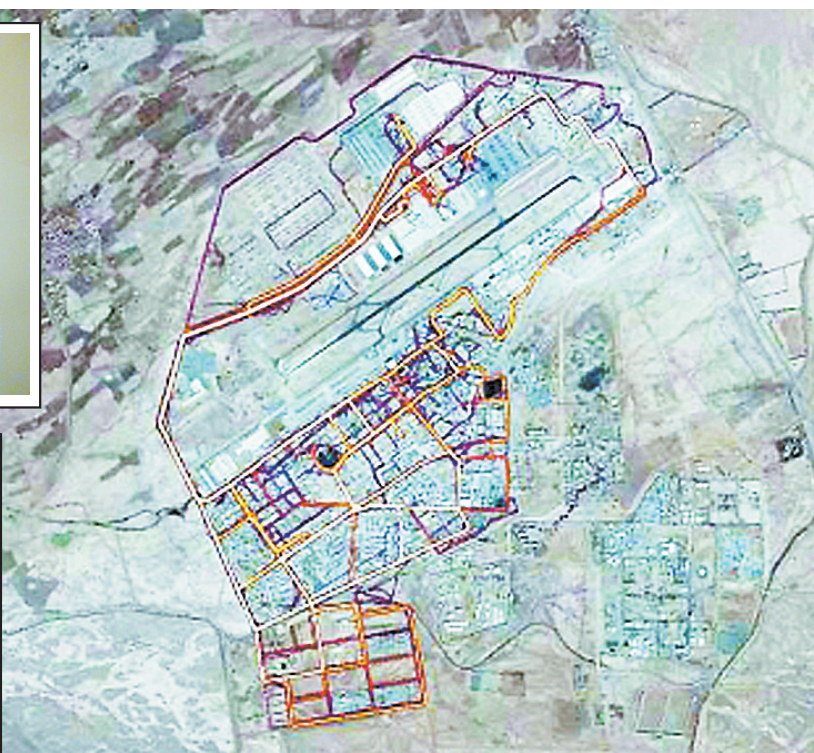
美军驻阿富汗坎大哈空军基地的轮廓图在跑步轨迹追踪APP上一览无余(上图)。