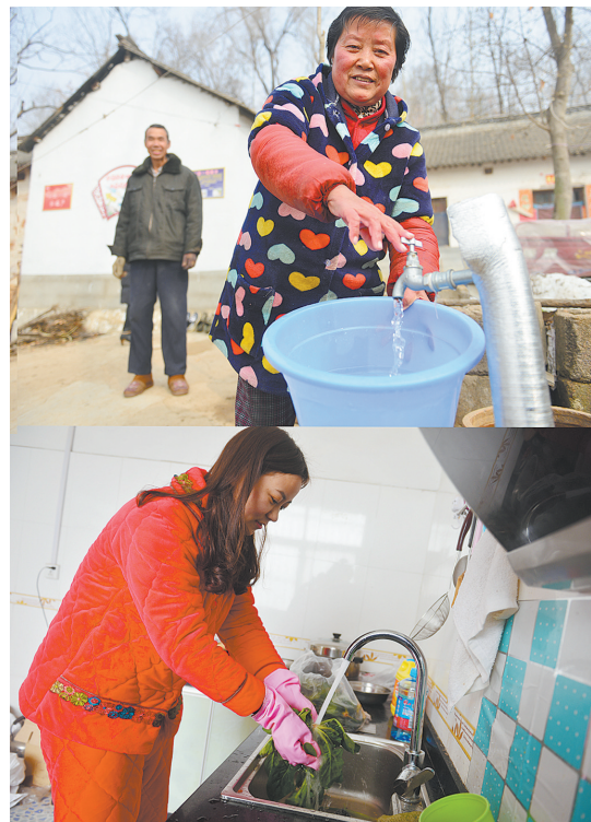
鲁山县库区乡(上图)和仓头乡军王村的村民(下图)用上了安全的自来水。