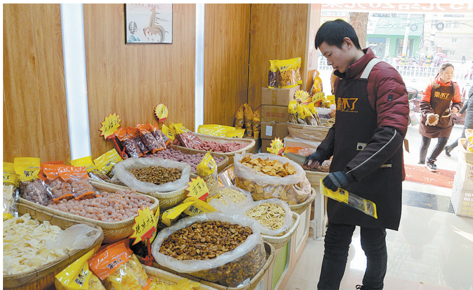
市区矿工路中段栗不了干果店里,销售员忙着给干果装袋。